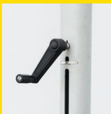
Aluminiummast mit Kurbel