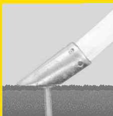
Zeltfuß aus Aluminiumguss